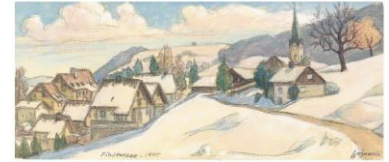
Gedanken Carl Bossard